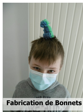
Fabrication de Bonnets

Quizz, chasse au trésor, orientation et jeux sportifs : luge, hockey..