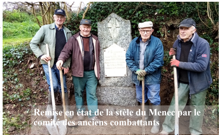
Remise en état de la stèle du Menec par le comité des anciens combattants

C'est un devoir de mémoire que d'y participer en tant que citoyens.