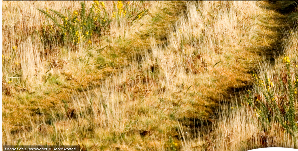
Landes de Guernélahet