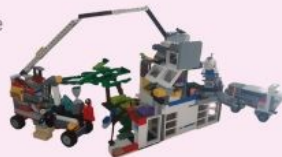
Construction d'une base navale