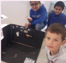
Réalisation de navette spatiale