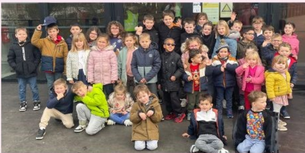
Noël pour tous à la Arena, mercredi 11 déc

L'équipe d'animation de Plouénan souhaite éveiller les enfants de 3 à 14 ans. Tous les mercredis et durant les vacances scolaires, elle accueille avec bienveillance et avec un programme d'animation varié vos enfants. Informations : 06 66 07 09 79 plouenan@epal.asso.fr