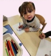
Bricolage : le système solaire et ses constellations