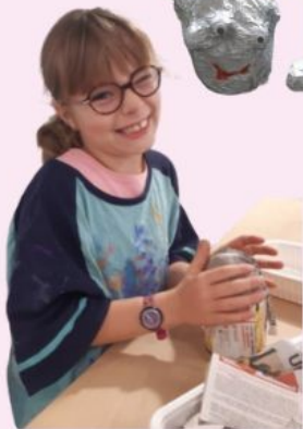
Des invités venus d'ailleurs

Chaque mercredi, le pôle animation de Plouénan accueille vos enfants (3-11 ans) avec enthousiasme pour des journées riches en découvertes et en activités. Dernièrement, c'est dans le cosmos, que vos enfants ont été plongés ! Ainsi, plusieurs notions liées à l'astronomie : comme l'exploration des constellations, du système solaire ont été abordées, permettant ainsi aux enfants de se familiariser avec les mystères de l'univers. Pour donner vie à leur imagination, ils ont également construit des navettes spatiales et réalisé des créations étonnantes grâce au papier mâché, donnant forme à d'incroyables "invités venus d'ailleurs".