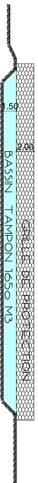
COUPE SUR BASSIN / TERRE NATURELLE